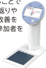
「健幸aiちゃん」 © Q'sfix

人 町内在住の40~64歳でスマートフォンアプリLINEが利用でき、事業に継続して参加できる方 20人 (年齢基準日は令和5年3月31日)