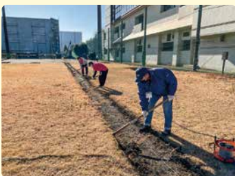
第1号公園野球場の整備の様子

スポーツ施設を安全・安心に利用できるよう、町スポーツ推進委員の皆さんが施設の保守作業を行いました。今年第1号公園で、体育館トレーニングルーム内の器具の配置替えや、野球場の整備を行いました。