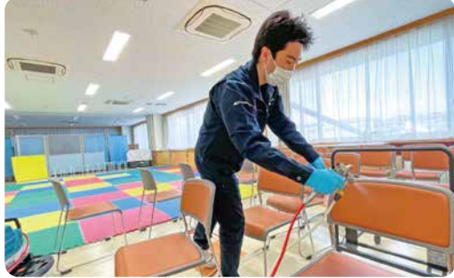
コーティング施工の様子

これは、コーティング剤を室内や備品などに噴霧・定着させ、付着するウイルスや細菌を不活性化させるもので、新型コロナウイルス対策として、健康プラザのカウンターや健診室、エレベーターなどへ施工していただきました。