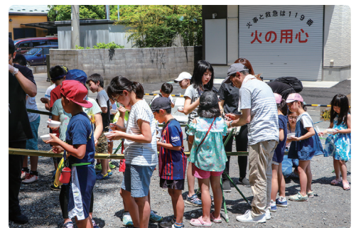
令和元年に熊坂区で開催された「流しそうめん」