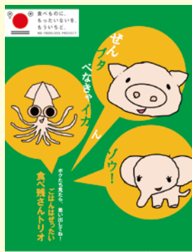
食品ロス削減推進ポスター

「食品ロス」とは、まだ食べられるのに捨てられてしまう食品廃棄物のことで、町内の家庭から出される「もやすごみ」のうち、約4分の1を占めています。