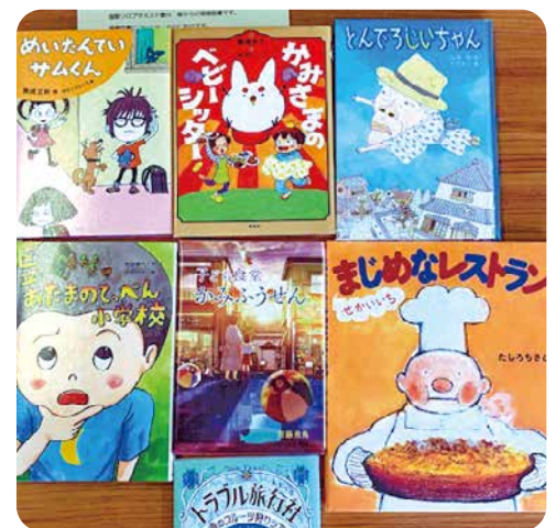
寄贈いただいた図書の一部

また、同会からは子どもたちの教育のためとして、毎年児童書を寄贈いただいております。本年度も85冊の児童書が寄贈されました。