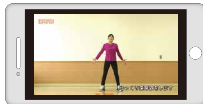
あいかわりフレッシュ健康体操

身体を伸ばす、ねじる、バランス、筋肉トレーニングや有酸素運動、ステップ運動などがトータルで効率的に行えるユニークな体操です。