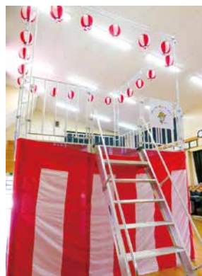
購入したやぐらセット

桜台区では、一般財団法人自治総合センターが実施しているコミュニティ助成事業（宝くじの受託事業収入が財源）を活用し、やぐらセットを購入しました。本年度の盆踊り大会は中止となりましたが、今後さまざまな行事に活用することで、地域のコミュニティ活動が