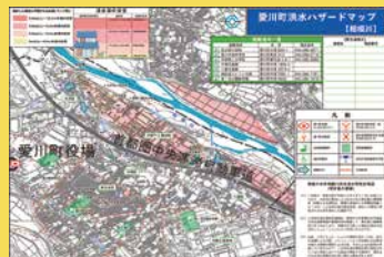
洪水ハザードマップ

近年、台風や線状降水帯の大雨により、各地で土砂崩れなどの災害が発生しています。お住まいの地域で災害が起こりやすい場所など、身近な危険箇所を「土砂災害ハザードマップ」や「洪水ハザードマップ」で確認しましょう。ハザードマップはラビンプラザやレディースプラザなどで入手できるほか、町ホームページでも確認することができます。