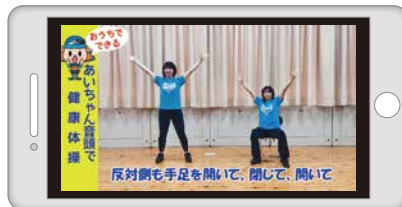
「あいちゃん音頭」健康体操

愛川町のイメージソング「あいちゃん音頭」のリズムにのせ、簡単な手足の運動で脳を活性化させる健康体操です。