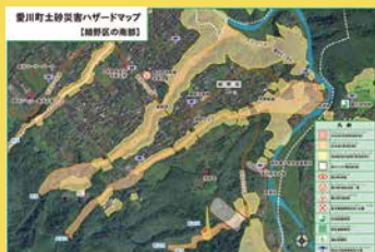
土砂災害ハザードマップ