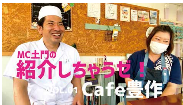
MC土門の紹介しちゃうぜ！VOL.1「Cafe豊作」より

昨年7月に認定された第2期愛川ブランドは、農産品などの一次産品や、スイーツ、料理、伝統工芸品など、22のブランドで構成されています。