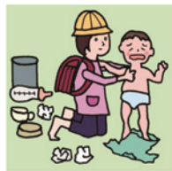
家族に代わり、幼いきょうだいの世話をしている