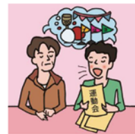
日本語が第一言語でない家族や障がいのある家族のために通訳をしている