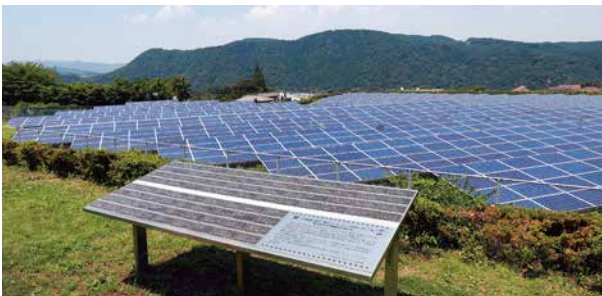
遊歩道に設置されているメッセージ板

発電設備の周辺は庭園や遊歩道となっており、自由に見学ができます。また、開所の際に一般から募集した「愛川ソーラーパークサポーター」の皆さんから寄せられたメッセージ板が、遊歩道に設置されています。未来に向けたメッセージの数々を、ぜひご覧ください。