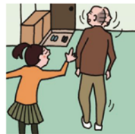
目を離せない家族の見守りや声かけなどの気づかいをしている