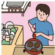
障がいや病気のある家族に代わり、買い物・料理・掃除・洗濯などの家事をしている

家族にケアを要する人がいる場合に、大人が担うようなケア責任を引き受け、家事や家族の世話、介護、感情面のサポートなどを行っている18歳未満の子どもをいいます。