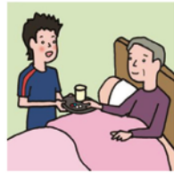
がん・難病・精神疾患など慢性的な病気の家族の看病をしている