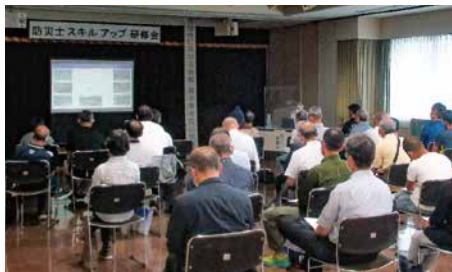
熱心に講演を聴く防災士の皆さん

研修会には、防災士の方など35人が参加し、専門講師による地震・風水害対応についての講演のほか、活発な意見交換などが行われました。