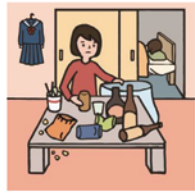
アルコール・薬物・ギャンブル問題を抱える家族に対応している