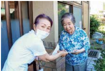
「元気券」を配布する民生委員さん(左)

日頃から民生委員の見守りを受けている、4月1日現在の「ひとり暮らし高齢者登録世帯」を対象に、日常生活を元気に過ごしていただけるよう、民生委員の皆さんのご協力をいただき、1人当たり1,000円分の「元気券」(200円券×5枚)を配布しました。