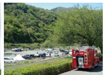
消防車による呼び掛け