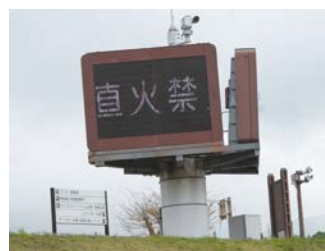
電光掲示板による呼び掛け

中津川の河川敷は、キャンプやバーベキューなど、多数の方に利用されています。直火禁止やごみの持ち帰り、感染症予防といったマナーを守っていただけるよう、町では電光掲示板や消防車などにより啓発を行っています。