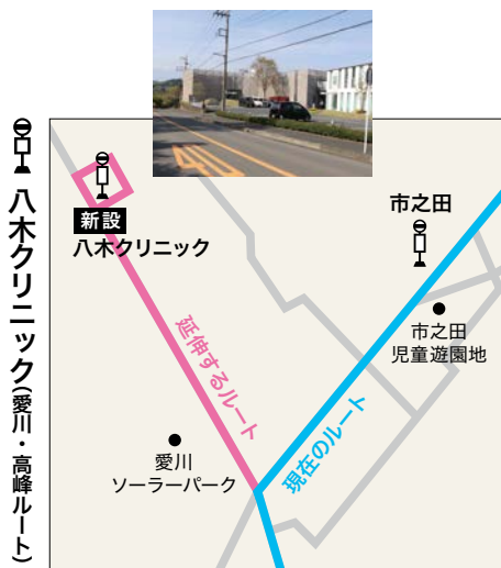
バス停の場所: 八木クリニック前