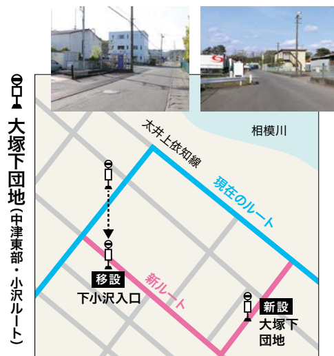
バス停の場所: 「大塚下団地」(楳いづみの先) 「下小沢入口」(尚コスモクリーン先)