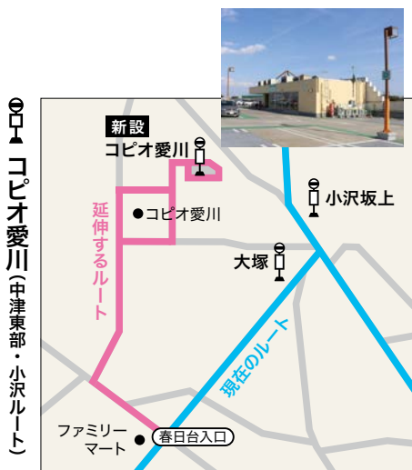
バス停の場所: スーパーアルプス屋上駐車場