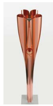
東京2020 パラリンピック 聖火リレートーチ