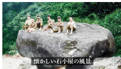
懐かしい石小屋の風景