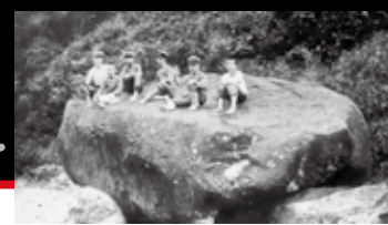
古写真を鮮やかにカラー化!