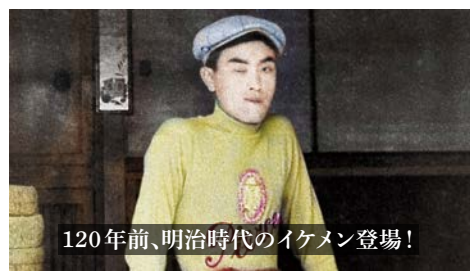
120年前、明治時代のイケメン登場!