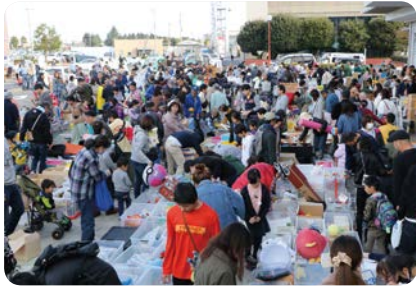
衣類・小物いいものありますコーナー

また、家庭で余っている食品を引き取り、食事に不自由している方などを支援しているNPO法人へ寄付する「フードドライブ」を実施。乾麺や缶詰、レトルト食品、お菓子など、多くの食品が集まりました。