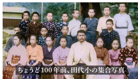
ちょうど100年前、田代小の集合写真