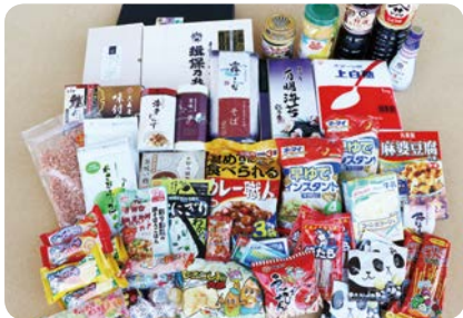
フードドライブに集まった食品