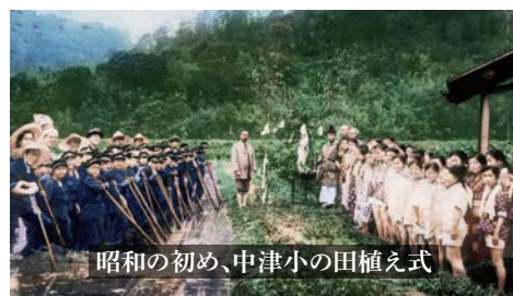
昭和の初め、中津小の田植え式