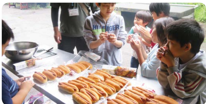
カートンドッグ作りの様子

当日は、約100人の子供たちが参加し、ジュニアリーダーや青少年指導員などのサポートのもと野外クッキングやゲームを行い、楽しい夏の1日を満喫しました。