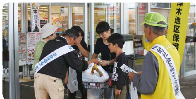
街頭キャンペーンの様子

7月7日、保護司会と更生保護女性会を中心とした、約30人の「社会を明るくする運動推進委員」の皆さんが、街頭キャンペーンとして、町内2カ所のスーパーマーケットの店頭で啓発物品などを配布しました。