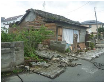
平成28年熊本地震で倒壊した建物とブロック塀