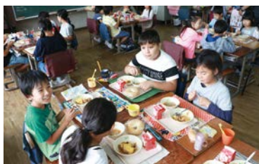
オリパラ給食を楽しむ中津小学校の児童たち

来年開催される東京オリンピック・パラリンピックにちなんで、子供たちにさまざまな国の食文化に接してもらうため、町内の小学校で7月から毎月1回、世界各国の献立を提供する「オリパラ給食」を実施しています。