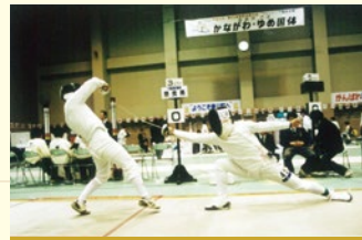
平成10年10月 第53回国民体育大会フェンシング競技を開催