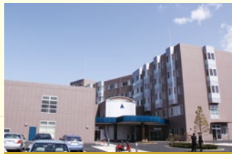
平成21年5月 愛川北部病院を誘致