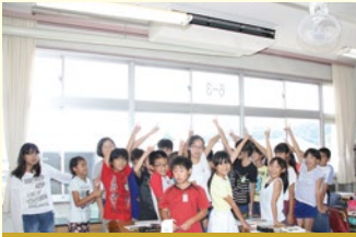
平成28年9月 町立小中学校にエアコンを設置