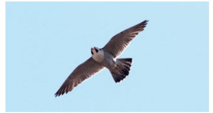
展示予定写真