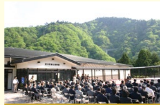
平成21年4月 郷土資料館がオープン