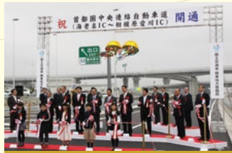
平成25年3月 圏央道「相模原愛川インターチェンジ」が開通