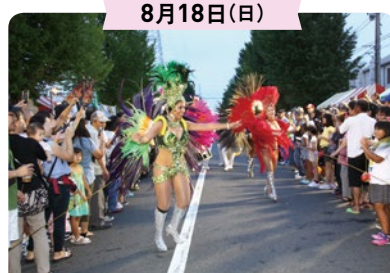
勤労祭 野外フェスティバル