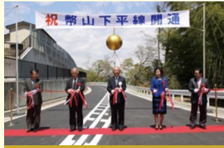
平成23年4月 町道・幣山下平線が開通