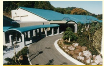
平成9年12月 愛川聖苑が運営開始