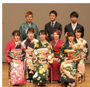
平成31年の実行委員の皆さん