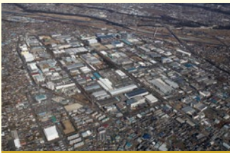
平成27年12月 神奈川県内陸工業団地協同組合創立50周年