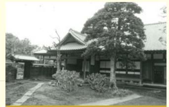
平成元年7月 古民家山十郎がオープン