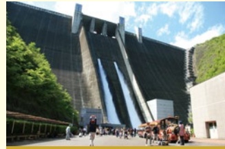
平成12年12月 宮ヶ瀬ダム完工式