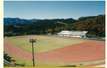
平成8年4月 三増公園陸上競技場がオープン