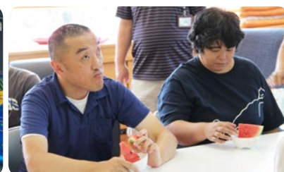
スイカを楽しむ「かえでの家」利用者の皆さん