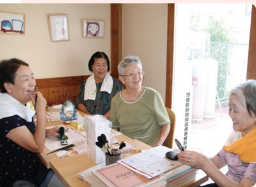
認知症予防カフェの「シニアいきいきメイクセミナー」