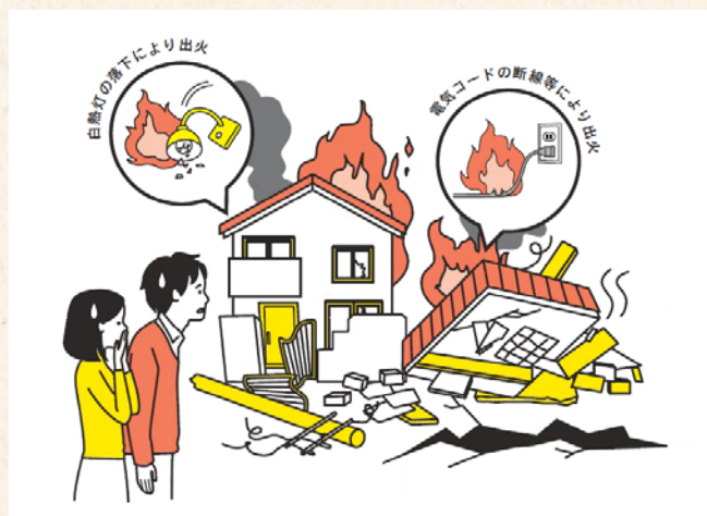
(内閣府、消防庁、経済産業省のパフレットから引用)

電気製品を使用中に揺れを感じたら、電源を切りましょう。また、避難する場合にはブレーカーを切るなどして、出火を防ぎましょう。