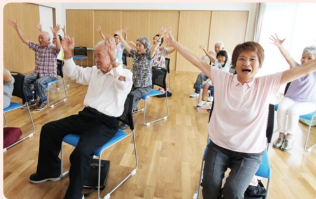
いきいき100歳体操(坂本区)

あるといわれる「しゃきしゃき100歳体操」という体操もあります。「いきいき100歳体操」と合わせて実施していただくと、さらに健康づくりに効果があります。