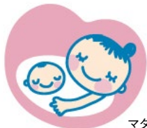
マタニティマーク

このグッズを身に付けている方を見かけたら、公共の乗り物では席を譲る、近くで喫煙しないなどの、思いやりある行動をお願いします。