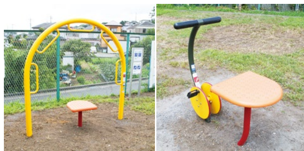
ストレッチフープ