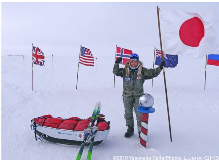
南極点到達時の写真