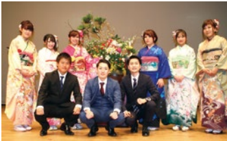
平成30年実行委員の皆さん