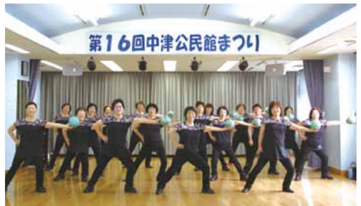
日頃の活動の成果を発表する公民館まつり

年間を通してさまざまな事業を開催しています。皆さんも興味のあることに参加して、「社会教育」に触れてみませんか。詳しい内容はお問い合わせください。