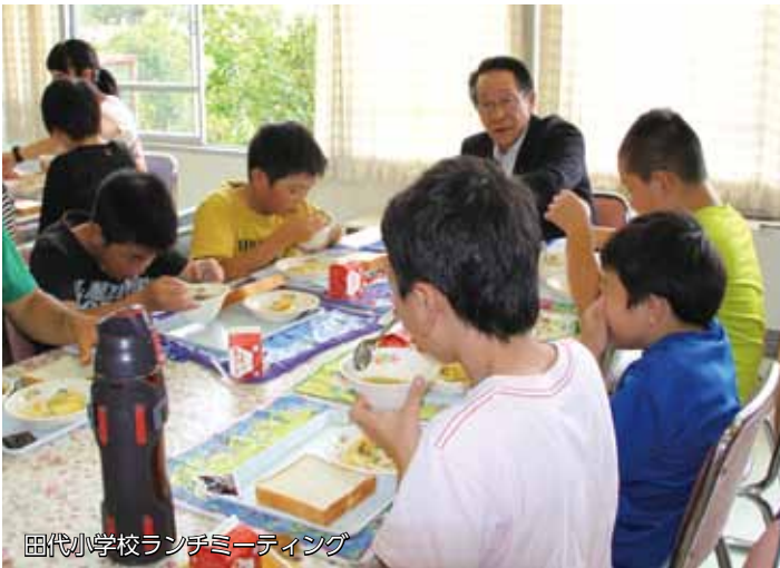
田代小学校ランチミーティング