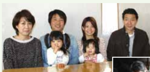
熊澤さんご家族と近所に住むご両親

「愛川町を選んだきっかけの一つになったのが、三世代同居の補助金です。引っ越しを考えているタイミングで友達が教えてくれたので、話を聞いて背中を押されました」と、ご主人は話します。