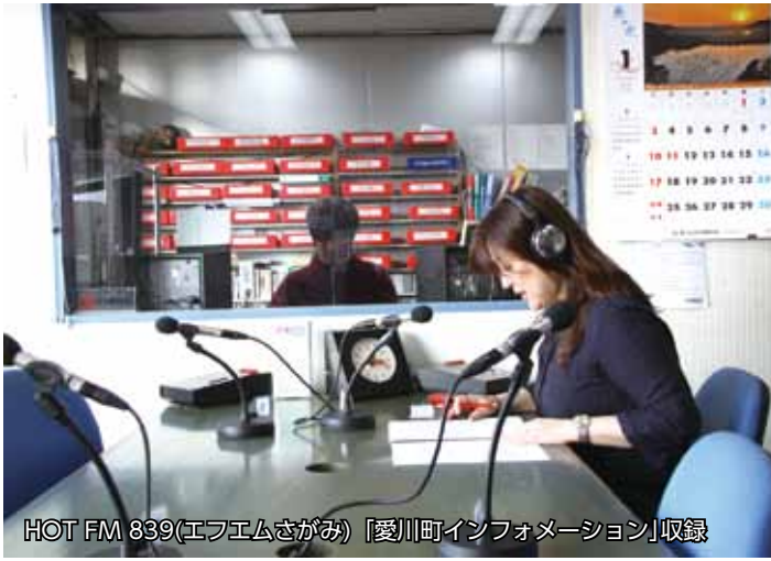
HOT FM 839(エフエムさがみ)「愛川町インフォメーション」収録