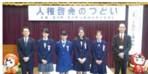
表彰された中学生の皆さん