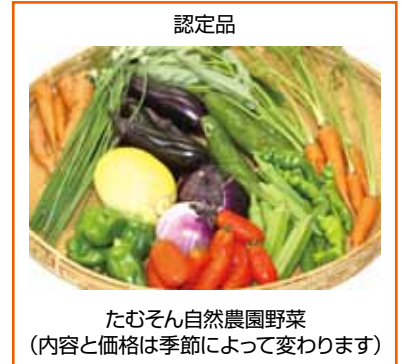
認定品 たむそん自然農園野菜 (内容と価格は季節によって変わります)

「愛川町は生命力にあふれているところが魅力です。この土地でしか作ることでできない野菜を味わっていただき、自然農法の良さを知ってもらいたいです」