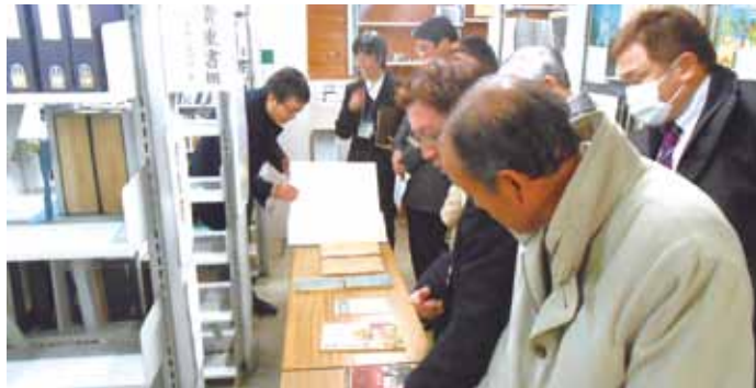
社会教育委員による研修視察(県立図書館)

社会教育とは、「学校・家庭以外の広く社会で行われる教育」です。身近なところでは、公民館や文化会館などでの講座や青少年教育事業、大学の公開講座、個人経営ピアノ教室でのレッスンなども社会教育です。