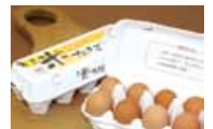
お米たまご 380円(10個入り)