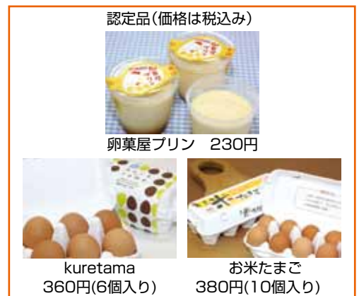
認定品(価格は税込み)

「ニワトリを健康的に育てるためには飼育環境が大切です。愛川町は空気がきれいなことに加えて、丹沢水系の伏流水を与えることができます。恵まれた自然が魅力です」