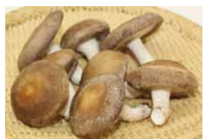
木精しいたけ(1袋400～525円)