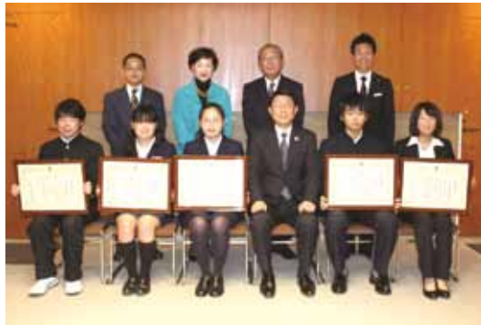
▲表彰された皆さん

受賞者は、大会でのエピソードや今後の抱負などを述べ、「良い結果を残し、皆様にまた報告ができるように頑