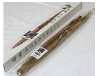
愛川自然薯 (1kgあたり2,000円程度)