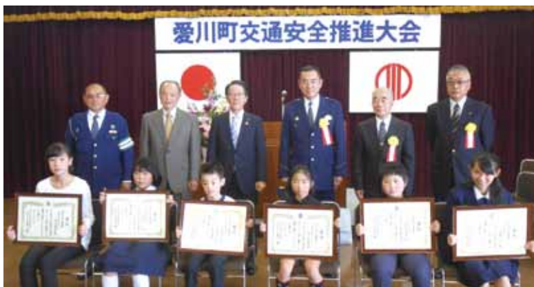
▲表彰された皆さん

当日は、交通安全に功績のあった方々に対する表彰式や交通安全作文の朗読が行われました。