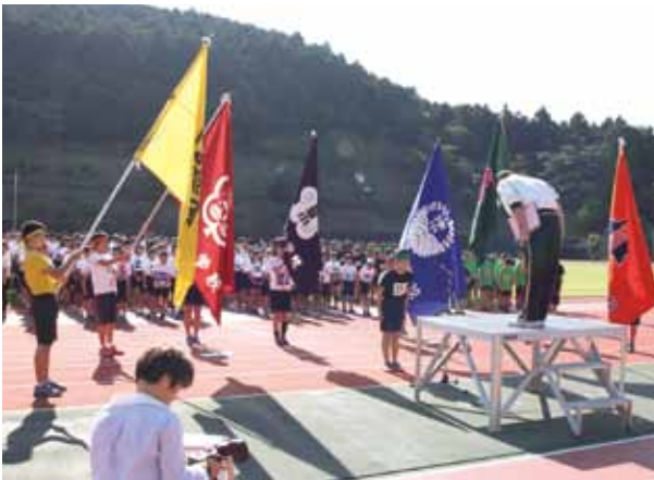
小学校連合運動会

町内の全小学校が集う連合運動会の開催、行政区などの対抗による町一周駅伝競走大会の開催、誰でも気軽に楽しめる、健康・体力の増進につながるスポーツレクリエーションの実施など