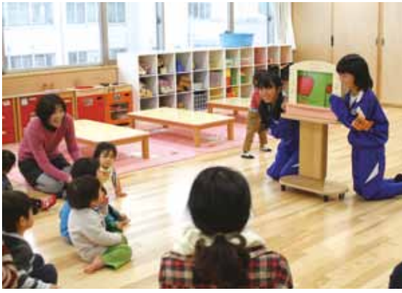
中学校2年生による職場体験

中学校2年生を対象とする町内事業所などでの職場体験の実施、青少年健全育成のためのジュニアリーダー研修会の開催、町内小学校で高齢者をはじめとした地域の方々との児童が交流するふれあいレクリエーションの実施など