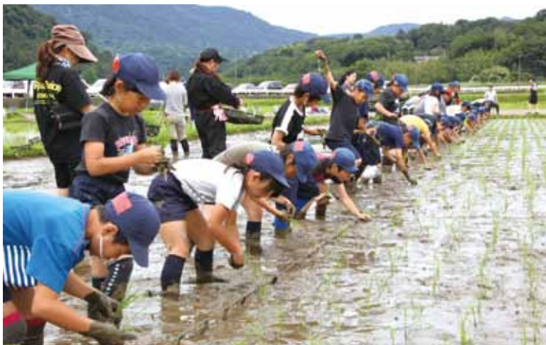
小学生の農業体験

基本理念では、学力向上はもちろんのこと、友達や親、家族を大切にすること、心の教育を推進、また、愛川町を愛し、いつまでも愛川町に住み続けたいという思いの醸成など、人間形成の教育を大切にしています。