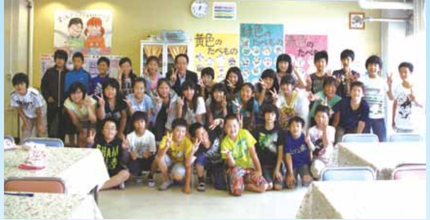
町長とのランチミーティング後に

この「愛川町教育大綱」では、「自らが真理を求めようとする意欲や探究心を培う自学自律の精神」「人間関係を大切にしていける社会性を身につけること」など、人間形成の教育に努め、町民一人一人がより魅力的な人となっていくことを目指して、次の理念を掲げています。