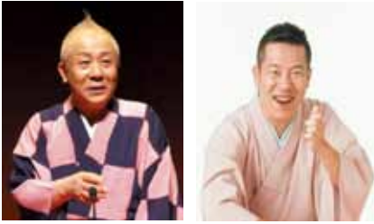
春風亭小朝 林家木久蔵

テレビやラジオなどでおなじみの春風亭小朝と林家木久蔵の落語会を開催します。話術と想像力のコラボレーションが魅力の落語をお楽しみください。