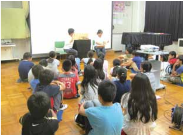
おはなしボランティアによる読み聞かせ

小中学校図書館の充実を図るための学校図書館指導員の派遣、児童生徒の読書普及を図るための読書ボランティアへの支援、町オリジナルブックガイド「ブックナビ」による読書の啓発など