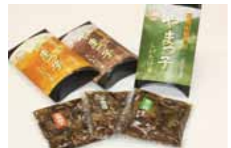
やまっ子山詩舞 各860円