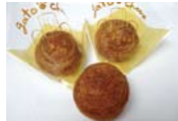
ジャージーシュー 173円