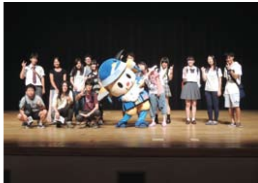
音楽祭実行委員の皆さん