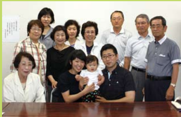
川合さんご家族(中央)とメンバーの皆さん