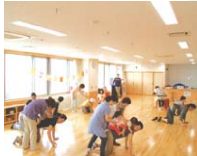
お父さんのための講座 「パパの背中に乗って遊ぼう」

また、スキンシップは乳幼児期の一時的なものだけではなく、小・中学生になっても続けていきたい大事な親子のかかわり方です。親に寄り添ってきたら受け入れて、一日のうち、ほんの数分でも親子の時間を持ちましょう。