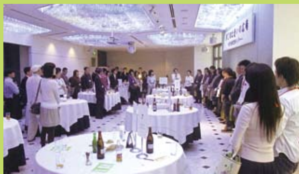
「出逢いの広場」の様子