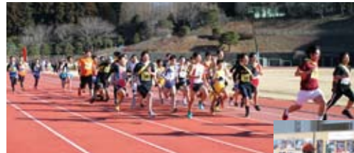
▲三増陸上競技場をスタート

また第60回を記念して過去の大会写真を集めた「今昔写真展」を開催し、大会の歴史を振り返りました。