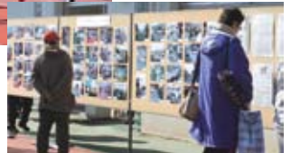
▼60年を記念した写真展