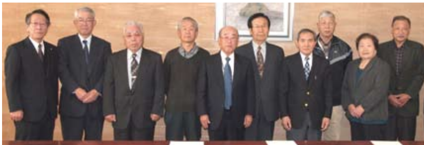
▲表彰された皆さんと町長

この表彰は「愛川町みんなで守る環境美化のまち条例」に基づき、多年にわたり環境美化活動に優れた功績のあった個人や団体を表彰するもので、本年度が初の実施となります。