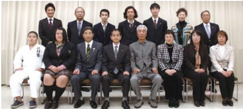
▲表彰された皆さんと教育委員

は、とても良い経験になりました。今後も良い結果を出せるように頑張ります」と力強く語っていました。教育委員長からは「それぞれ練習に励んで一歩一歩前に進み、目標を達成してください」と激励の言葉が贈られました。