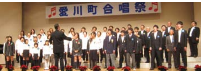
▲記念合唱団による合唱

また、第10回を記念した合唱団も結成され、合唱初心者からベテランの方までが集まり、記念の合唱祭に花を添え、歌声を響かせました。