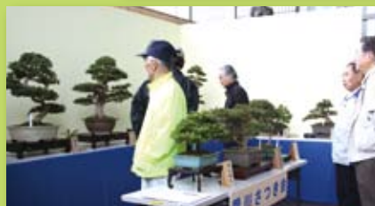
上部の写真4点は、5月30日～6月1日に開催された「花季展示会」。左の写真は、昨年10月に開催された「ふるさとまつり」秋季展。