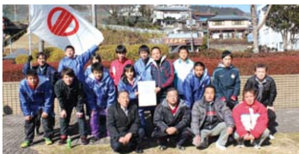
昨年の愛川町選手団