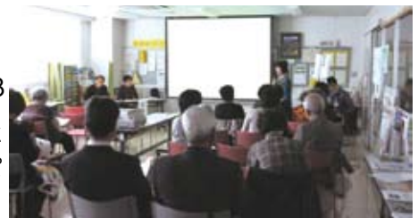
登録団体発表会の発表の様子

11月28日、サポートセンターに登録している福祉団体を対象とした懇談会を社会福祉協議会や町職員なども参加し開催しました。