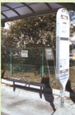
看板が設置された西二丁目バス停

を記載した看板を設置しました。引き続きパトロールなどを通じ環境美化を強化してまいります。