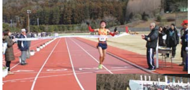
2連覇を達成した細野区