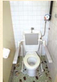
手すり・背もたれが設置されたトイレ

公共施設のバリアフリー化を推進するため、安心して利用していただけるよう、ひじ掛けが可動する便利な「トイレ用の手すり」を設置するとともに、楽な姿勢で便座に腰掛けることができる「背もたれ」も併せて設置します。