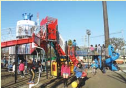
第1号公園トリム広場

トリム広場は、小さな子どもからお年寄りの方まで、幅広い年齢層を対象とした公園です。遊具の新設や既存遊具の更新、テーブル・ベンチの増設など、各種要望は、再整備の中で検討します。駐輪場の設置は、駐車場と区別して設置してまいります。公園施設内の環境整備は、公園管理職員による巡回や遊具の安全