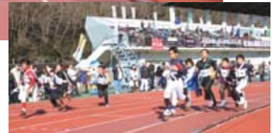
スポーツ少年団も力走

部には各行政区からの26チーム、第2部には友好都市・長野県立科町や企業、高校など17チームが参加し、合計43チームによる熱戦が繰り広げられました。