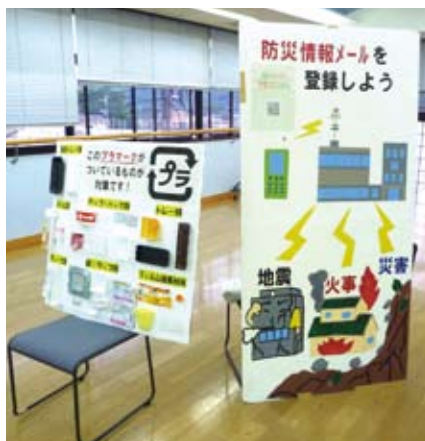
防災情報メールへの登録もお願いしました。

学校においても防災計画を見直すとともに、防災教育に取り組んでいます。また、県が作成した「学校における防災教育指導資料」を各学校に配付し、それに基づき防災教育を推進するよう依頼しています。 昨年度より「緊急時学校対応連絡協議会」を立ち上げ、地震発生時や荒天に伴う対応などについて協議することにも統一した対応についても共通理解を図っています。