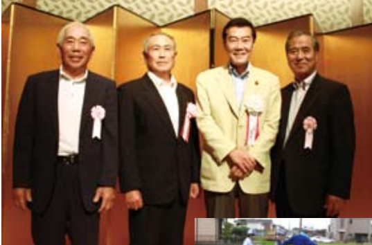
▲大塚壮青会のみなさん(右から2人目は横光環境副大臣)