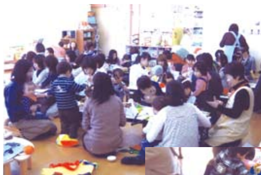
子育てホットタイム 「布おもちゃで遊ぼう」

スキンシップをしている大人にも相手への愛情が深まり、親子の間で「愛情の連鎖」が生まれるそうです。1日、5～10分でも十分効果がありますので、毎日楽しくおこなってみてくださいね。