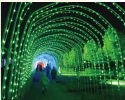
ふれ愛のトンネル

折からの寒波で凍てつくような寒さでしたが、訪れた中学生は「大道芸がとても楽しくて、寒さを忘れて夢中で見ました」と笑顔を見せていました。