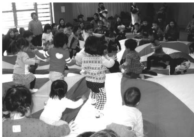
「親子で遊ぼう!」の様子