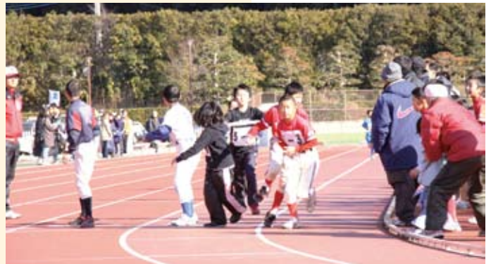
子どもたちも力走 ～スポーツ少年団ミニ駅伝～