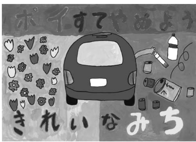
武内瑞貴さんの作品