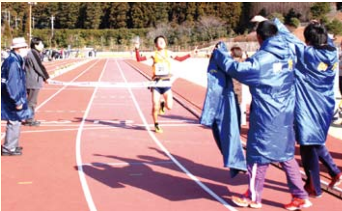
ゴールテープを切る細野区アンカー

競技場内ではスポーツ少年団によるミニ駅伝競走大会が開催され、レッドベアーズ(野球チーム)がトップ賞を獲得しました。