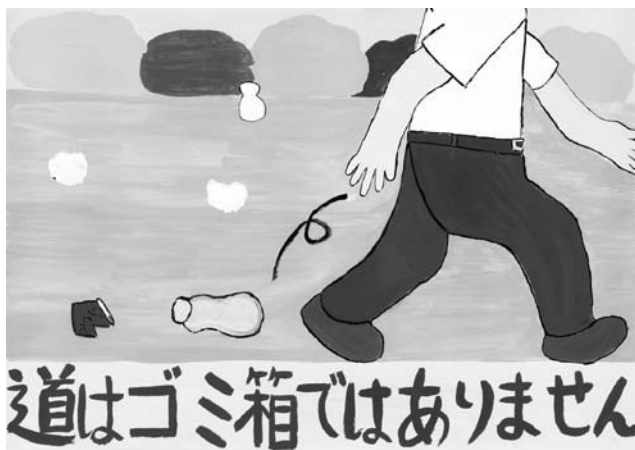
川村 梢さんの作品