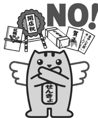
明るい選挙のキャラクター “選挙のめいすいくん”

問 厚木保健福祉事務所生活福祉課 ☎224-1111、町福祉支援課 障害福祉班 ☎（内線）3355