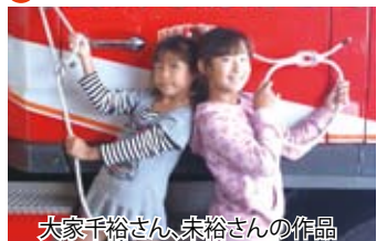
大家千裕さん、未裕さんの作品