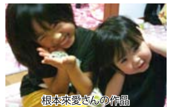
根本來愛さんの作品