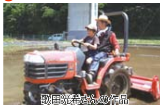
歌田光希さんの作品