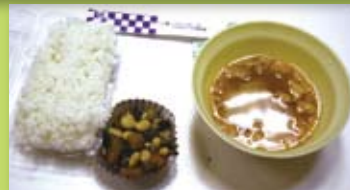
非常食体験の炊き出し