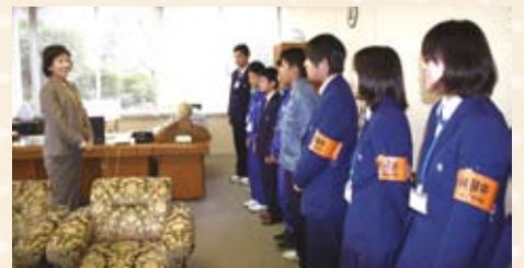
「3日間頑張ります」と町長へあいさつ