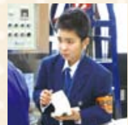
職場体験で取材・写真撮影をしました