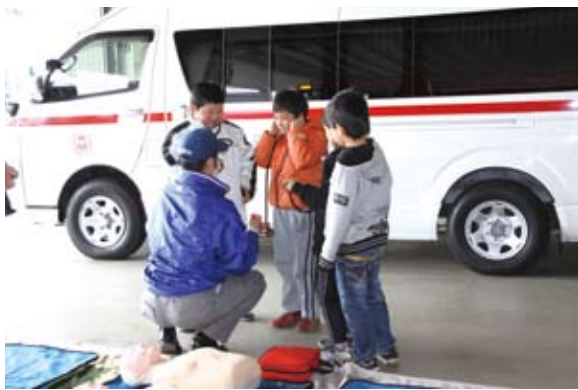
小学3年生の消防署見学

子どもたちは、疑似体験や間接体験が多くなる一方、社会体験や自然体験などの直接体験が不足し、親や先生以外の大人と接する機会