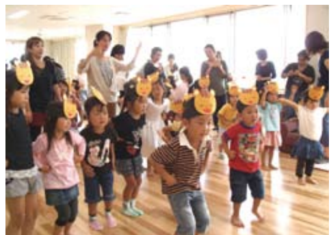
みんなでお遊戯楽しいね!

「あなたのことを、ちゃんと見ているよ」ということが伝われば、こうした行動も減少していきますよ。