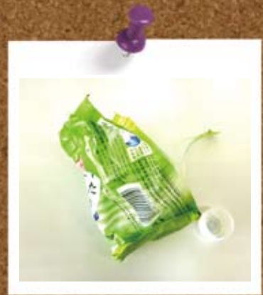
⑥ペットボトルのキャップとラベル