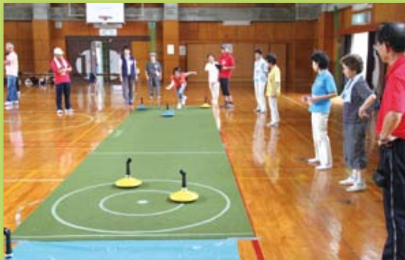
ニュースポーツ「ユニカール」体験