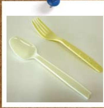
②プラスチック製のフォーク、スプーン