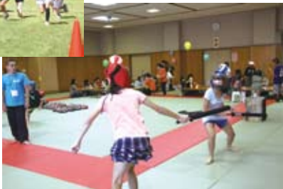
スポーツチャンバラ

10月13日に第1号公園で「2013あいかわスポーツ・レクリエーション・フェスティバル」が開催されました。子どもからお年寄りまで「いつでも・どこでも・だれでも」楽しめるスポーツやレクリエーションによって交流を深め、また健康増進を図るために27の種目が実施され、大勢の来場者がチャレンジしていました。