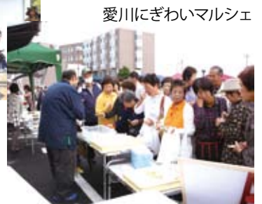
愛川にぎわいマルシェ