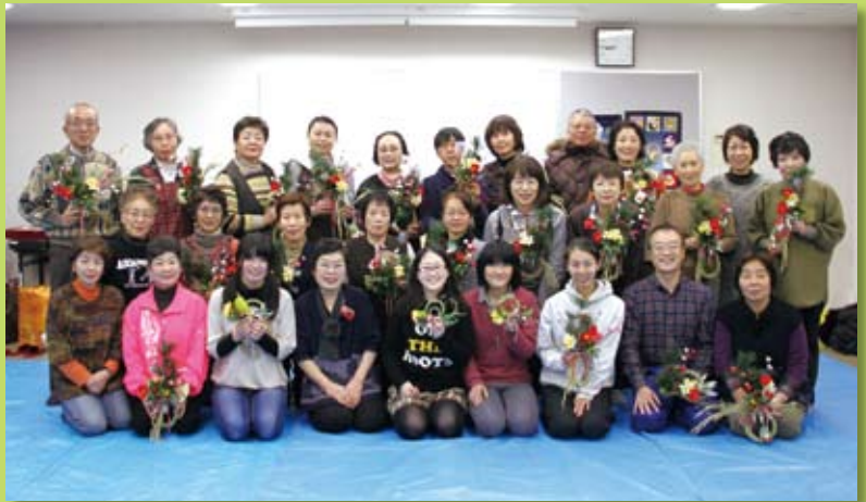
しめ縄飾りを作る会