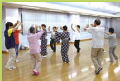
愛川町の民謡を学ぶ