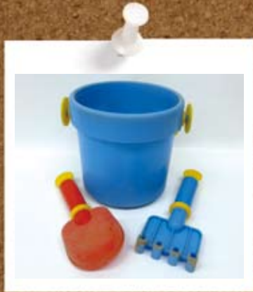
④プラスチック製のおもちゃ