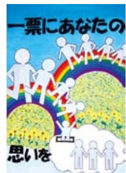
長嶋実貴さんの作品