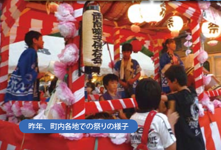
昨年、町内各地での祭りの様子