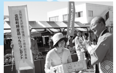
立科町友好都市提携20周年(平成19年)