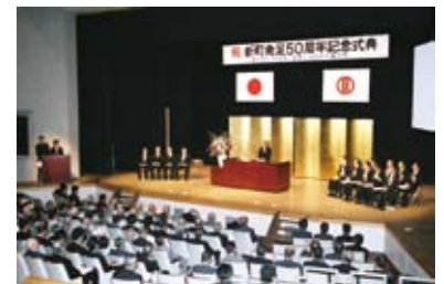
新町発足 50周年記念式典 (平成 17年 9月)