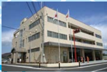
新消防庁舎運用開始 (平成 17年 3月)