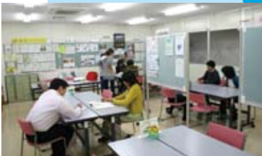
町民活動サポートセンターオープン (平成 19年 3月)