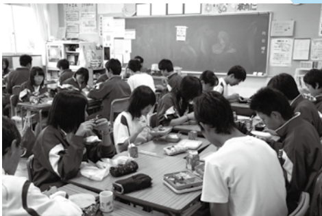
中学校給食開始(平成21年10月)