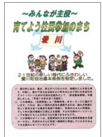
愛川町自治基本条例施行 (平成 16年 9月)