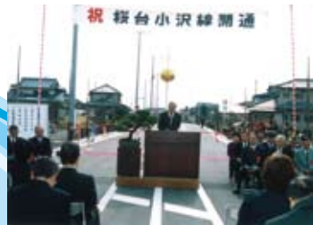
桜台小沢線開通 (平成 13年 2月)