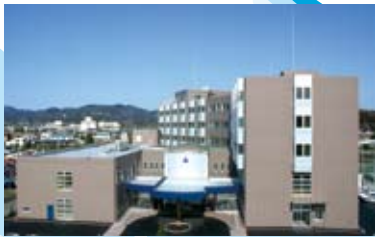
愛川北部病院・北部クリニック誘致 (平成 21年 5月オープン)

平成8年度から15年計画を進めてきた、第4次愛川町総合計画。町の将来像「ひかり、みどり、ゆとり、ふるさと愛川」の実現に向けて、さまざまな施策に取り組んできました。4月から新たにスタートする第5次愛川町総合計画の推進によって、さらにすばらしい町となることを願いつつ、これまでの15年間の町の歴史を写真で振り返ってみます。