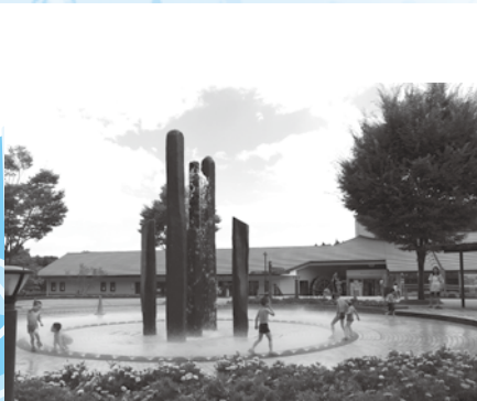
県立あいかわ公園開園(平成14年4月)