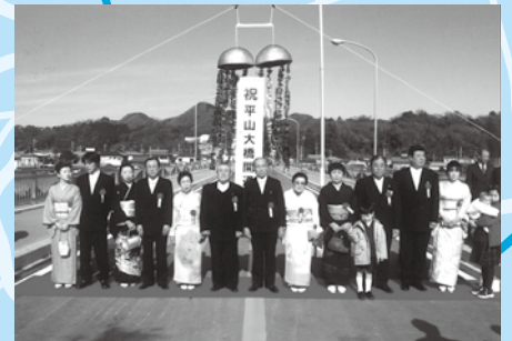
平山大橋開通(平成15年1月)