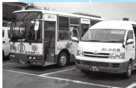
町内循環バス再編実証運行(平成20年10月)