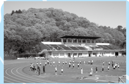
三増陸上競技場オープン(平成8年4月)