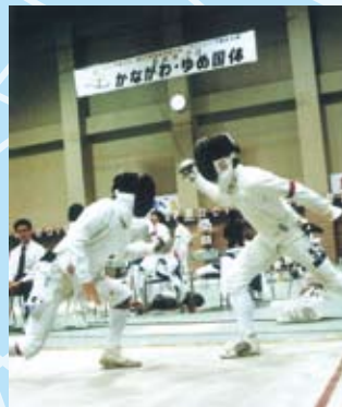
かながわ・ゆめ国体開催 (平成 10年 10月)