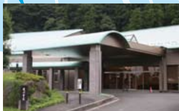
愛川聖苑運営開始 (平成 9年 12月)