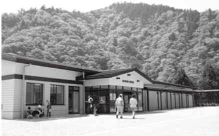
郷土資料館オープン(平成21年4月)