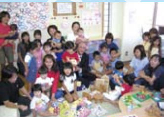
子育て支援センターオープン (平成 14年 9月)