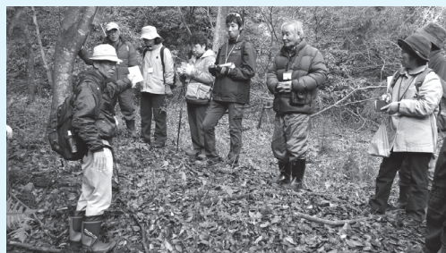
写真は、昨年12月11日「愛川層群の化石と地形の観察」の様子