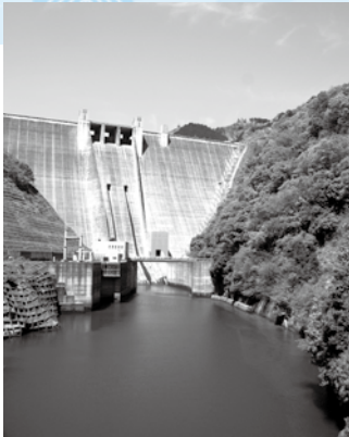
宮ヶ瀬ダム完成(平成12年12月)

※テレビからも山田町長がごあいさつを申し上げます。 tvk (テレビ神奈川) 新春特別番組「2011 かながわてれび年賀状」市町村長新春挨拶」1月2日 午前6時30分から放送予定