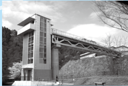
県立あいかわ公園ふれあい橋開通(平成22年3月)