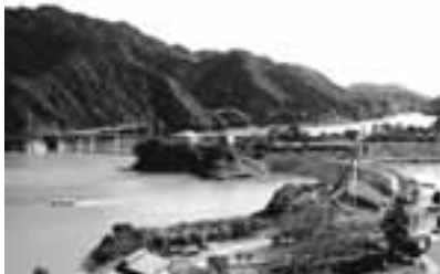
この写真は、前回の最優秀作品です。

清川村ホームページ ◆ http://www.town.kiyokawa.kanagawa.jp/