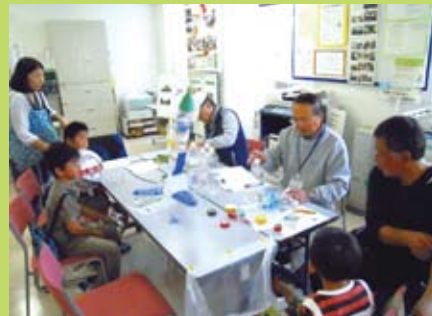
ふるさとまつりでのペットボトルロケット製作と打ち上げ体験