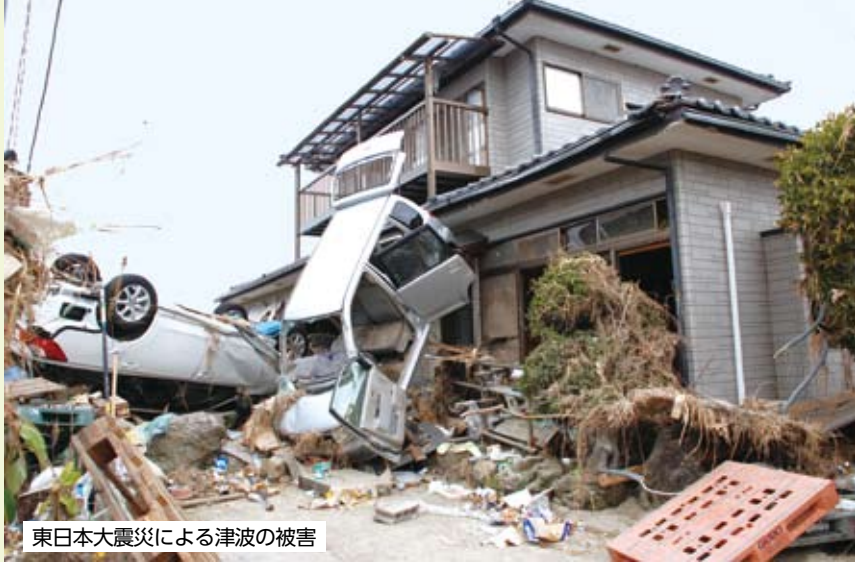
東日本大震災による津波の被害