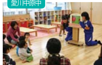
保育業務（子育て支援センター）