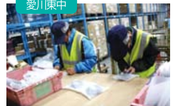
部品梱包作業（株）バンテックセントラル）