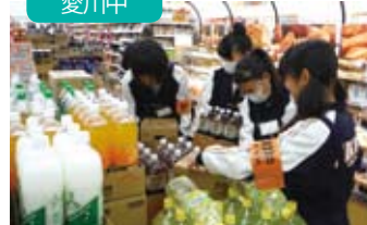
店頭への品出し（クリエイト）