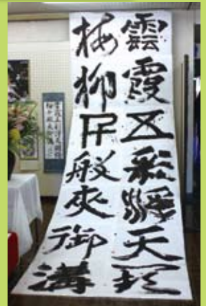
「遊び塾」書道作品展