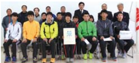
愛川町代表のみなさん

2月8日、県内の30市町が参加した「市町村対抗かながわ駅伝競走大会」が実施されました。