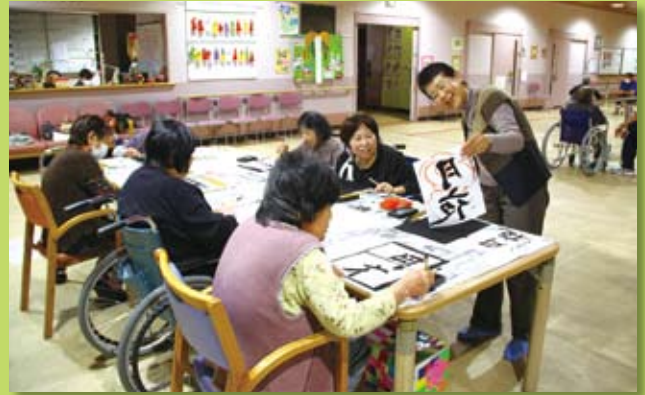
介護老人保健施設での書道の指導