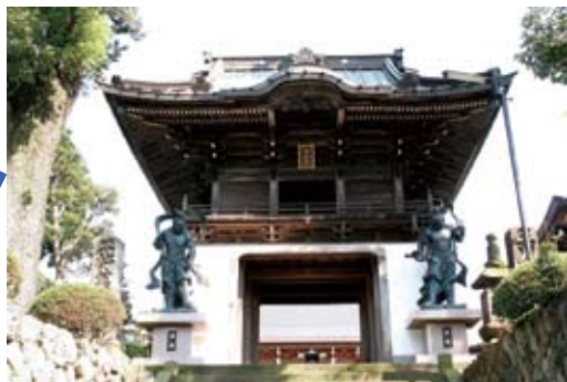
① 龍福寺の山門 ◆町指定◆建造物◆

安永7年(1778)建立の山門(三門)。総高9m、間口5.5m、奥行3.7m。木造総檜造り、屋根は銅板瓦棒葺(初期は茅葺)の入母屋、前面は唐破風、脚部は白壁造りで竜宮城を思わせる珍しい姿の楼門です。