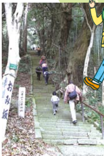
④ 八菅神社の社叢林 ◆県指定◆天然記念物◆