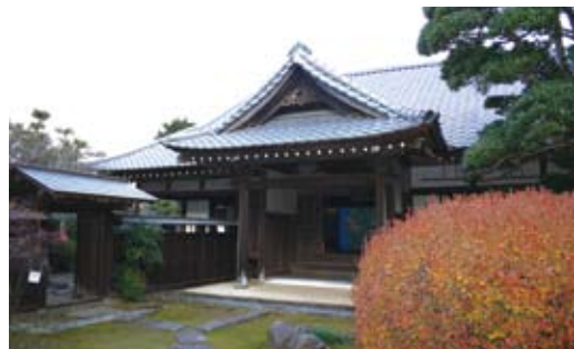
② 古民家山十郎 ◆国登録文化財◆建造物◆

安永7年(1778)建立の山門(三門)。総高9m、間口5.5m、奥行3.7m。木造総檜造り、屋根は銅板瓦棒葺(初期は茅葺)の入母屋、前面は唐破風、脚部は白壁造りで竜宮城を思わせる珍しい姿の楼門です。