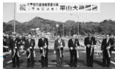
平成15年 平山大橋の開通式