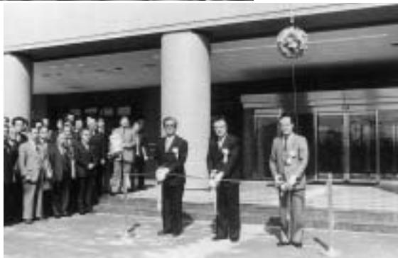
昭和62年 第1号公園体育館が完成