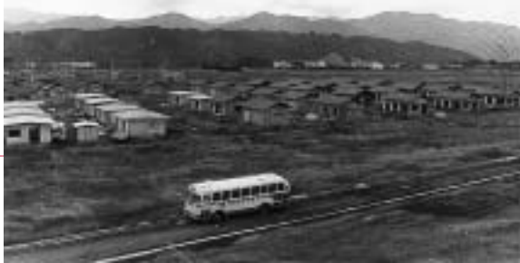
昭和43年 当時の春日台住宅団地

今年、愛川町が誕生して50年目の年となります。平成17年を記念する節目の年として位置付け、次のような事業を展開していく予定です。