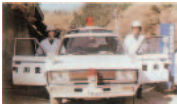
昭和45年 救急業務を開始