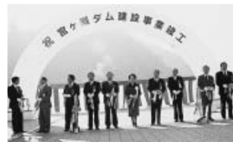
平成12年 宮ヶ瀬ダム完工式