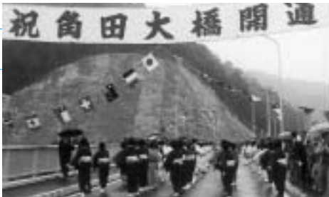
昭和56年 角田大橋開通記念

どうか、皆様にとって今年一年が実りある年でありませうと祈念いたしますとともに、町政運営に相変わらぬご指導とご協力をお願い申し上げます、新年の「あけましておめでとう」です。