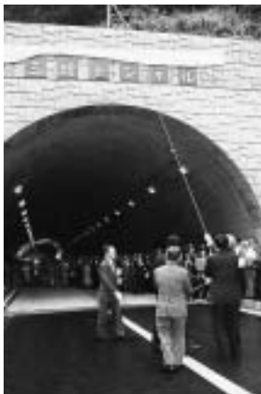
平成4年 三増トンネルが開通