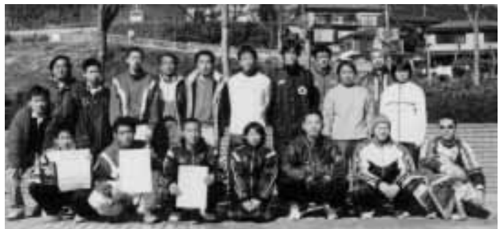
愛川町チームの皆さん