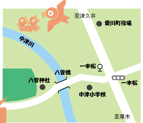
八菅山 いこいの森

県の天然記念物に指定されたスダジイの大木やモミなど多くの自然を保全しつつ整備された22.6ヘクタールにおよぶ自然公園の「八菅山いこいの森」。森の中にはアスレチックや展望台などもあり、家族や仲間同士でのハイキングに最適。もちろん小鳥のさえずりを聞きながら一人での散策も楽しめます。(駐車場有り)