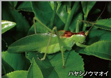
ハヤシノウマオイ