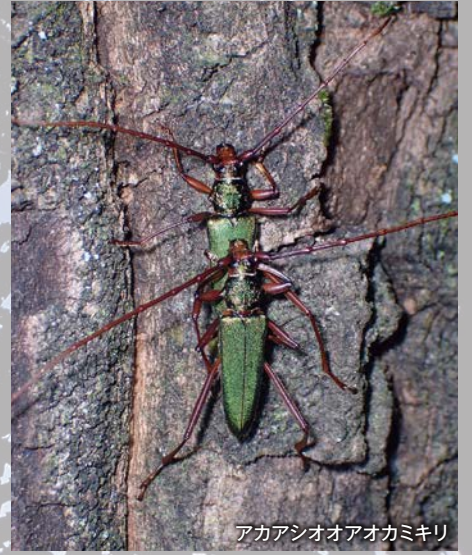
アカアシオアオカミキリ