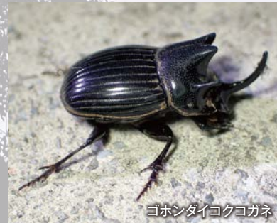
ゴホンダイコクコガネ