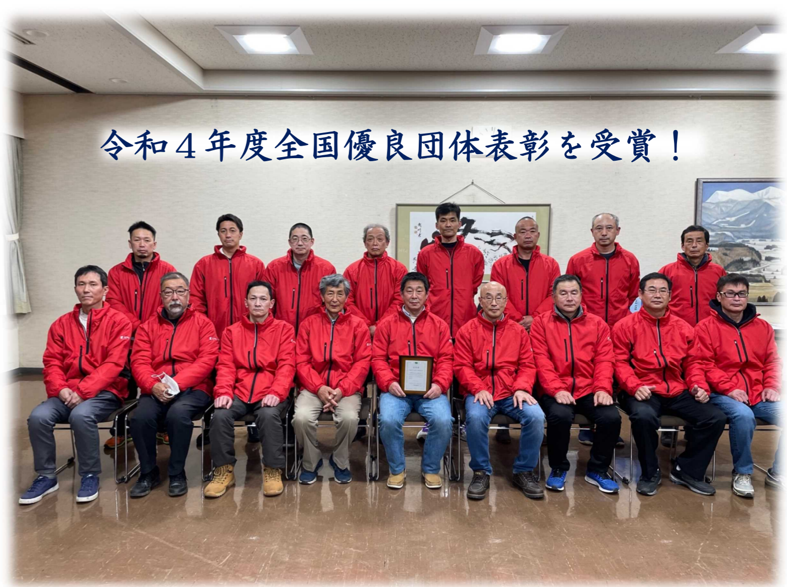
令和4年度全国優良団体表彰を受賞！