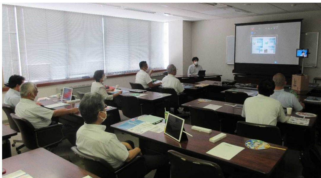
会議システムのデモンストレーション（令和4年8月3日）