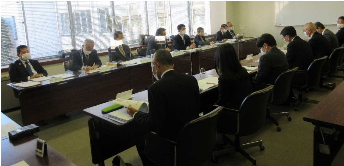
12月定例会で提出された議案について審査を行いました