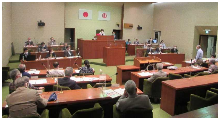
約3年ぶりとなる町民との意見交換会を開催しました