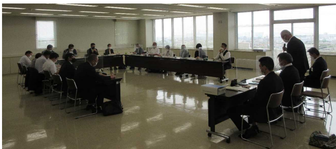
第6次愛川町総合計画（案）について議会内で検討を重ねました