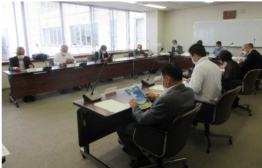
委員会の様子 (令和4年10月17日 広報広聴常任委員会)