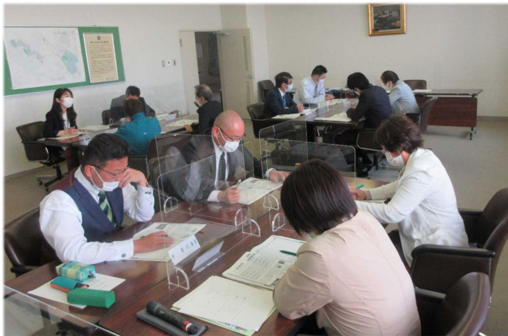
グループに分かれ、議会だよりの内容（一般質問の見出し等）を検討