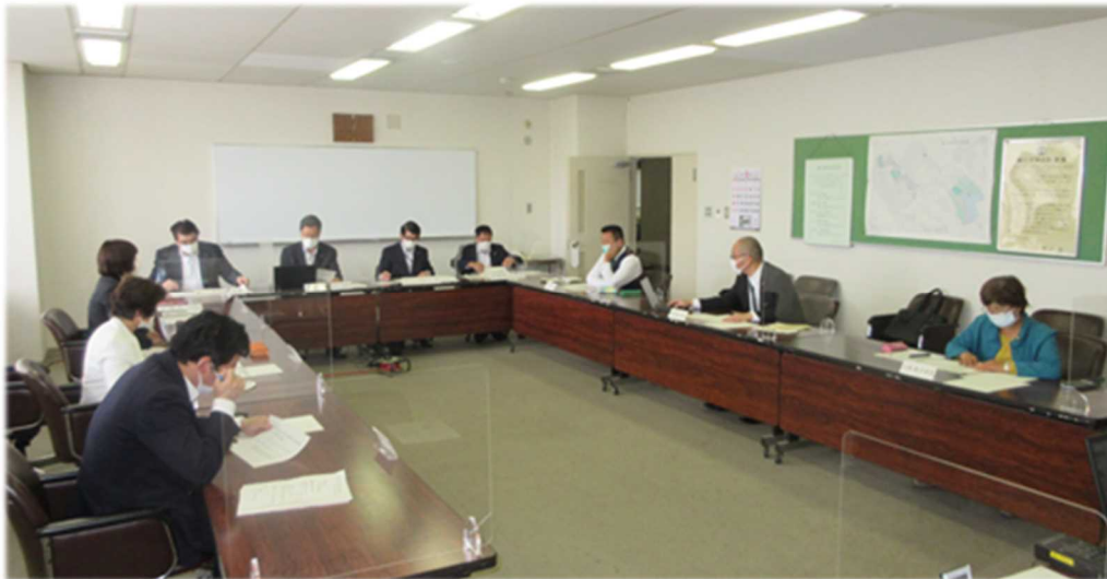
委員会の様子 (令和3年5月14日)