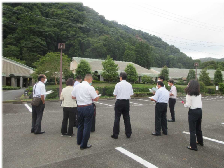
8月所管事務調査の様子：愛川聖苑