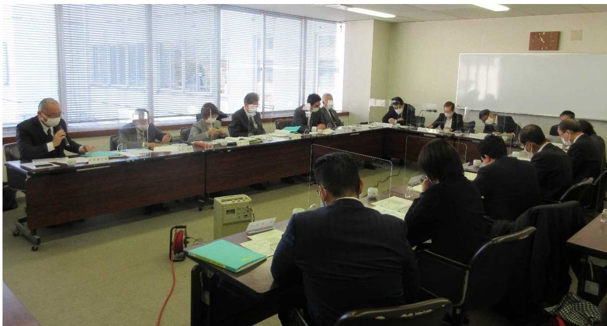
本条例の目的が達成されているか、全議員で検証を行いました