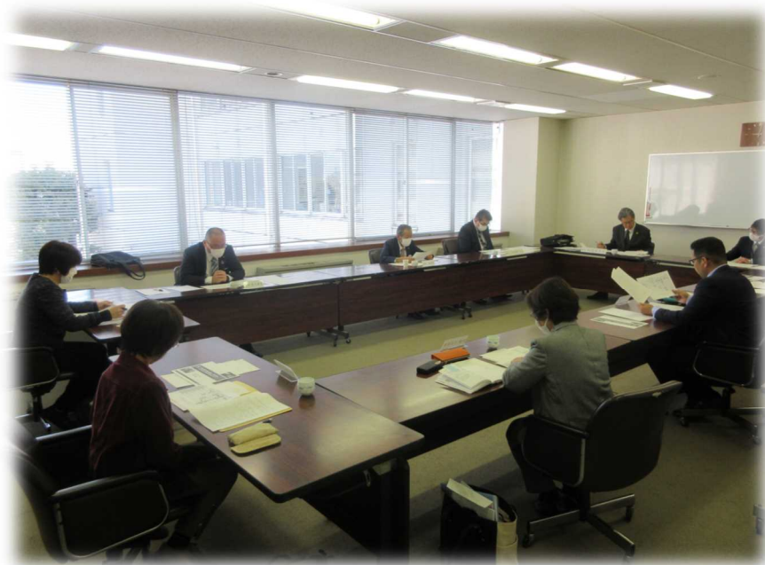
ソーシャルディスタンスを確保して会議を開催