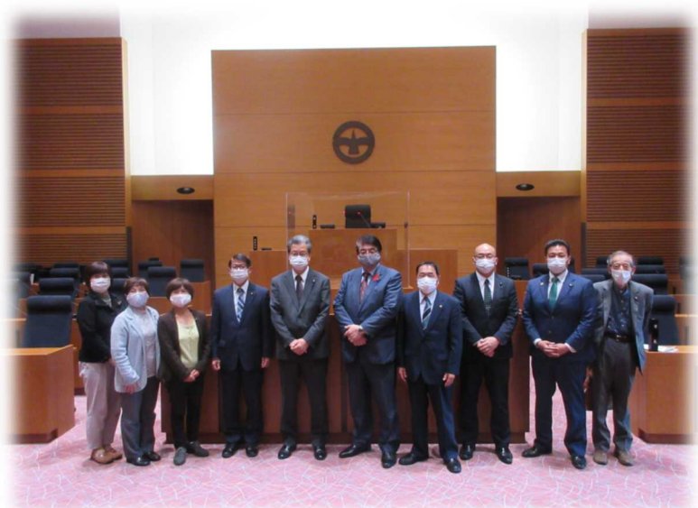
町田市議会視察の様子