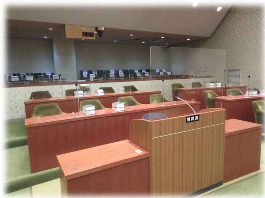
コロナ対策をした議場の様子

【提出先】衆議院議長、参議院議長、内閣総理大臣、財務大臣、総務大臣、厚生労働大臣、経済産業大臣、内閣官房長官、経済再生担当大臣、まち・ひと・しごと創生担当大臣