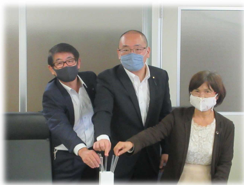
議会クイズ当選者の抽選