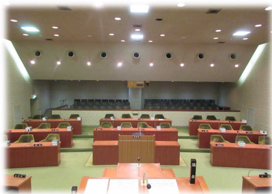
議長席から見た議場の様子 (アクリル板等設置前)