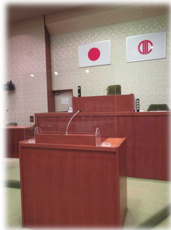
登壇席にも飛沫防止のためアクリル板を設置