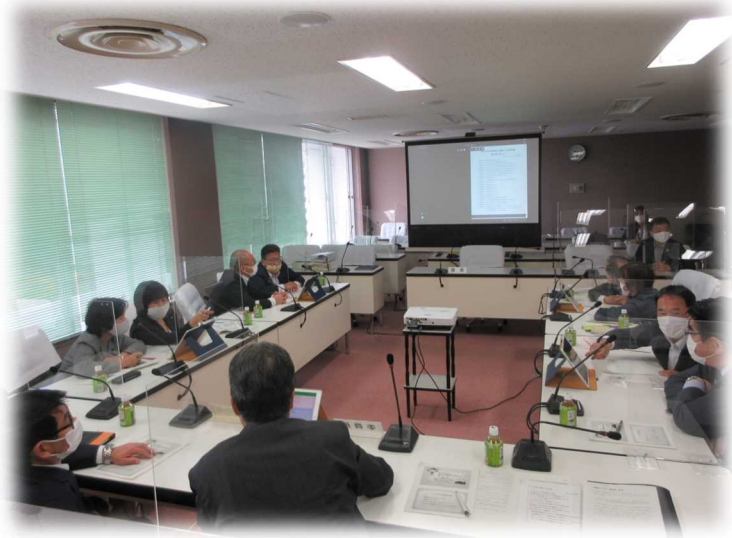
厚木市議会視察の様子