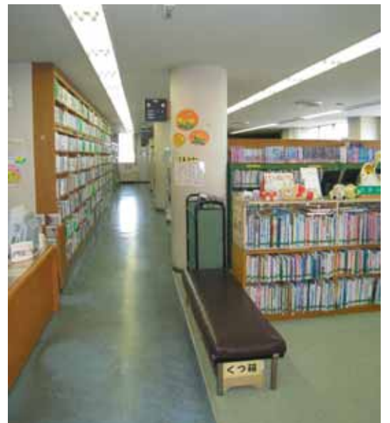
町文化会館の図書館