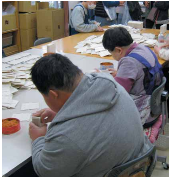
障がい者就労施設での製品作成（ありんこ作業所）