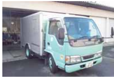
更新予定のし尿収集車

問 し尿収集車の購入に 関し、架装仕様及び納入 時期の決定方法について 答 架装仕様は、3t級 トラックシャーシに容量 2千700リットル以上 のタンクを設置し、パキ ュームポンプと自動巻き ホースリールを取り付け 外装は上部を除く4面を アルミパネルで覆い、後 部にアルミシャッターを 施したものです。