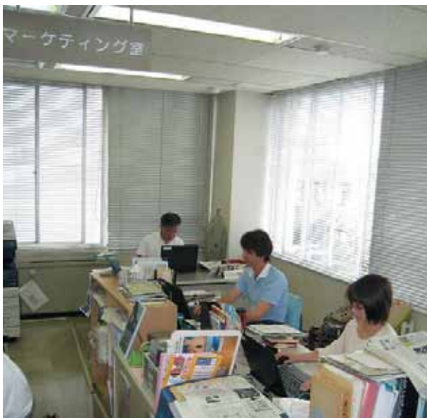
4月に新設されたマーケティング室

体的な町のビジョン・戦略を定めるための基本方針や、それらを実現するためのアクションプランの検討を行っています。 また、町の現状と課題の分析や地域ブランド確立に向けた調査などについて、協議・検討を重ねるとともに、先進事例等の情報収集などにも努めています。