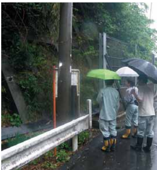
急傾斜地崩壊対策事業実施箇所（半原地内） 県職員とパトロールを実施

予防対策については、 町広報紙やホームページ、 防犯情報メールによる周 知啓発をはじめ、被害の リスクが高いといわれる 高齢者を対象とした防犯 講座開催など、総合的な 取り組みを進めています。 また、3月には、防災 無線による緊急的な周知 を行ったほか、町内金融 機関に対して、窓口対応 の強化を要請するなど、 タイムリーで効果的な対 策を講じたところです。