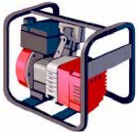
発電機などの取扱注意!!

平成25年8月に京都府福知山市の火花大会で発生した火災の教訓を踏まえ、「消防法施行令」の一部が改正されたことに伴