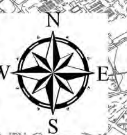
相模川水系中津川洪水浸水想定区域図(浸水継続時間)