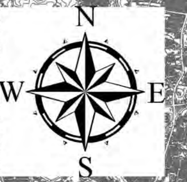
相模川水系相模川洪水浸水想定区域図(計画規模)