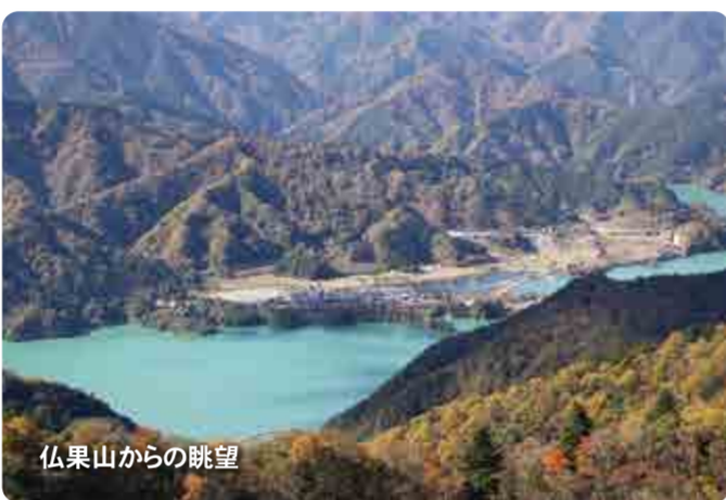
仏果山からの眺望

弘法大師が経文を納めたと言われる巨岩「経石」がある経ヶ岳から、室町時代に清川村の正住寺を開いた仏果禅師が座禅修行したことからの名がついた仏果山、眺望の良い高取山を縦走するコースです。経ヶ岳、仏果山の頂上手前の登山道では岩場やヤセ尾根があり、ピーク間の高低差もあるため、健脚の方におすすめです。 参考コースタイム ：Q 半僧坊前【H90m】→(50分)→法華峰林道合流点→(40分)→経ヶ岳【H633m】→(20分)→半原越え【H480m】→(35分)→土山峠との分岐→(60分)→仏果山【H747m】→※以下「① 仏果山・高取山登山」のコースと同じ。 ●歩行時間 約5時間30分 ●高低差 約650m