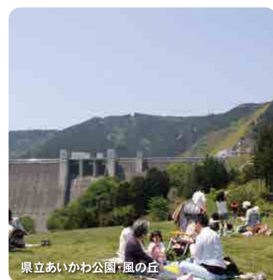
県立あいかわ公園・風の丘

宮ヶ瀬ダムは重力式コンクリートダムで堤高156m、ダム内にはエレベーターがあり天端上がることが出来ます。天端上がると、約2億トンの水をたたえる首都圏最大級の水がためである宮ヶ瀬湖が広がります。宮ヶ瀬湖は、愛川町・相模原市・清川村にまたがり、その広さは東京ドームのおよそ100倍です。遊覧船で湖面を周遊したり、ダムの役割や発電の仕組みがわかる水とエネルギー館を見学したりできます。また、宮ヶ瀬ダムの下には石小屋ダム、新石小屋橋があり、エメラルド色の水をたたえています。 県立あいかわ公園はダムに隣接し、風の丘、冒険の森など自然に触れながら散歩したり遊んだりすることができます。その他にも、工芸工房村での手作り体験、郷土資料館など、見どころがいっぱいです。 また、宮ヶ瀬ダム、新石小屋橋は「あいかわ景勝10選」に選ばれています。 パーク＆ウォーク ：県立あいかわ公園駐車場に車を置き、宮ヶ瀬ダム、県立あいかわ公園を散歩することができます。 アクセス ：半原バス停から徒歩30分(ダム下まで)