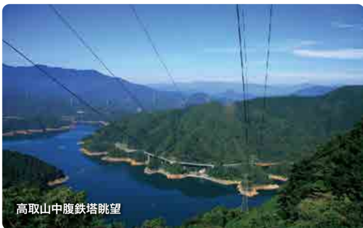
高取山中腹鉄塔眺望

宮ヶ瀬湖や丹沢山地を眺めながらの山歩きは、新緑・深緑・紅葉・落葉といずれの季節も楽しめます。仏果山と高取山の山頂にある展望台(10m)では、360度のパノラマの眺望が楽しめます。天気の良い日に、都心や横浜の風景も見ることが出来ます。 参考コースタイム ：Q 燃糸組合前【H120m】→(35分)→県道514号・宮沢橋→(85分)→仏果山【H747m】※→(15分)→宮ヶ瀬湖【H662m】→(10分)→高取山【H705m】→(55分)→宮ヶ瀬湖登山口【H290m】→(10分)→宮ヶ瀬ダム堤体下→(30分)→Q 半原【H120m】 ●歩行時間 約4時間 ●高低差 約620m