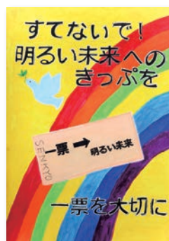
林ミントアンさんの作品