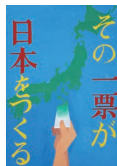
湯原妃夏さんの作品