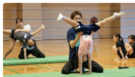
田中先生からマット運動を教わる参加者の子ども

オリンピック・田中和仁先生の体操教室は、神奈川県との令和7年度かながわアスリートネットワーク 協働事業として実施しました。