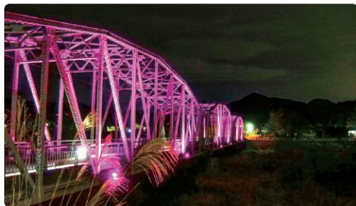
ピンク色にライトアップされた平山橋