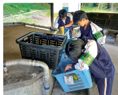
過去の職場体験の様子

11月6日(木)・7日(金)の2日間、中学2年生による職場体験を実施します。町内3中学校、約290人の生徒たちが、町内外の約90力所の事業所などで、職場体験に取り組みます。職場体験では、生徒たちが働くことの大切さや意義、社会人としてのマナーなどを理解するとともに、自分の生き方や将来について見つめることを目指しています。慣れない環境の中で職場体験に挑んでいる生徒たちを見かけましたら、温かく見守ってください。