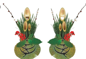
幅:約15cm、高さ:約26cm(1基あたり)

「広報あいかわ」へのご意見・ご感想をお寄せください。町では、伝わりやすく、町民皆さんの行動につながるような情報発信に努めています。広報紙を読んだご感想や掲載された情報へのご意見をお聞かせください。問 政策秘書課 秘書広報班 ☎(内線)3213