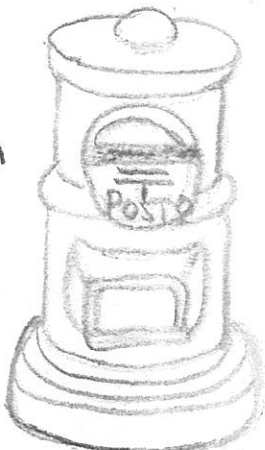
たよりで、電話でつながろう