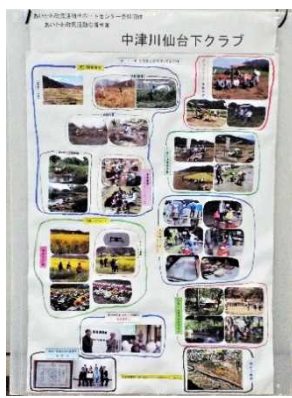
中津川仙台下クラブ