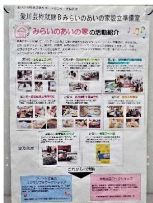
愛川芸術就継B 未来のあいの家 設立準備室