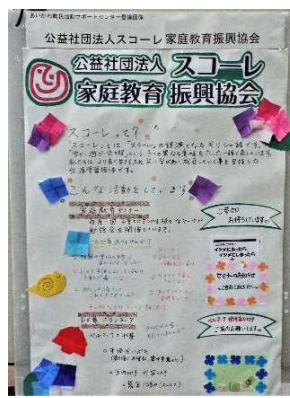
公益社団法人スコーレ 家庭教育振興協会