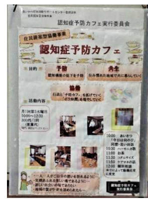
認知症予防カフェ実 行委員会